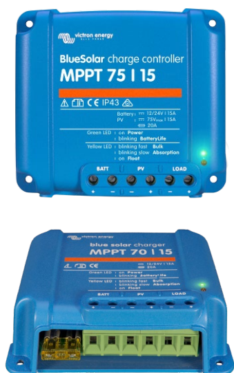
Solar Charge Controller MPPT 75/15